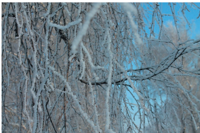
Октябрь в Надеждино