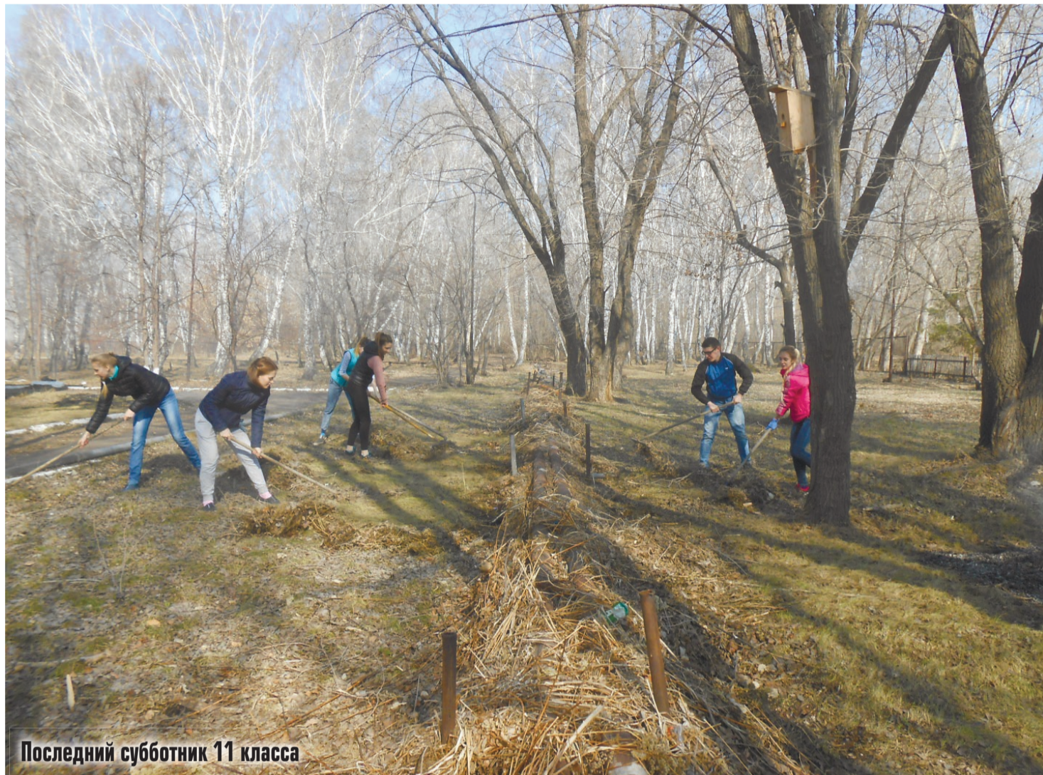
Последний субботник 11 класса

Экология в нашей стране занимает очень важное место. Раньше люди жили по сто лет, а сейчас долгожителей на Земле почти не ос-