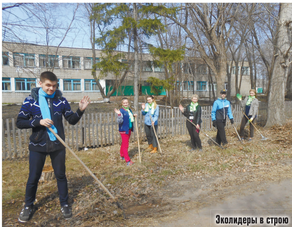
Зколидеры в строю